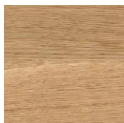
3058 Бесцветное матовое