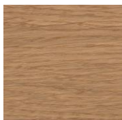
3028 Бесцветное шелковисто- матовое